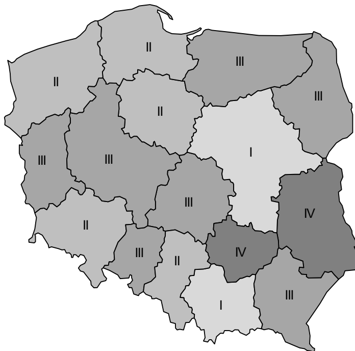
Ryc. 1. Przestrzenna delimitacja województw Polski (podział na klasy I–IV)

W pierwszej klasie znalazły się dwa województwa: mazowieckie i małopolskie, z największymi średnimi wartościami większości cech, np.: X_2 , X_5 – X_{12} , X_{14} – X_{15} . W grupie tej jest najwięcej czytelników na 1000 osób. Zaobserwowano także najwięcej uczestników imprez zorganizowanych przez centra kultury, domy i ośrodki kultury, kluby i świetlice w przeliczeniu na jedną instytucję oraz różnych kursów zorganizowanych przez te ośrodki. W przypadku wystawiennictwa i działalności teatrów odnotowano również największe średnie wartości wszystkich rozpatrywanych cech.