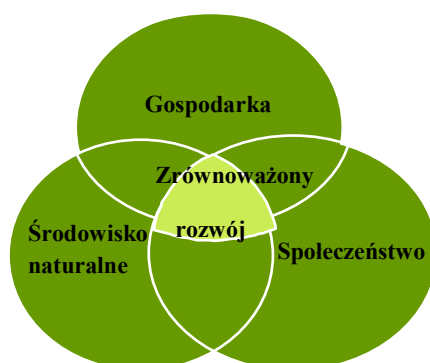
Rys. 1. Model zrównoważonego rozwoju gospodarki

Tylko harmonijne sterowanie przez decydentów współdziałaniem czynników rozwojowych w tych trzech obszarach umożliwi najbardziej klarowny i niezakłócony rozwój na wzór porządku panującego w przyrodzie i pozwoli zapewnić ludzkiej cywilizacji równowagę zewnętrzną (otoczenie gospodarcze i środowiskowe) i wewnętrzną (jakość życia). Rolnictwo i gospodarka wiejska są w naturalnych sposób dziedzinami gospodarki i życia społecznego, gdzie kontakt ze środowiskiem jest bezpośredni i gdzie relacje, jakie zachodzą między tymi wymiarami, mają znaczenie wykraczające poza granice sektora i przestrzeni, z którą są związane. Coraz powszechniej uważa się, że rozwój wsi i rolnictwa powinien być zgodny z zasadami zrównoważonego rozwoju, który poprzez rozsądne gospodarowanie przestrzenią pozwolić powinien na długotrwałe wykorzystanie zasobów przyrody z jednoczesnym podnoszeniem efektywności ekonomicznej oraz poprawą jakości życia społeczeństwa wiejskiego (Adamowicz 2006). Model zrównoważonego rozwoju gospodarki został przedstawiony na rys. 1.