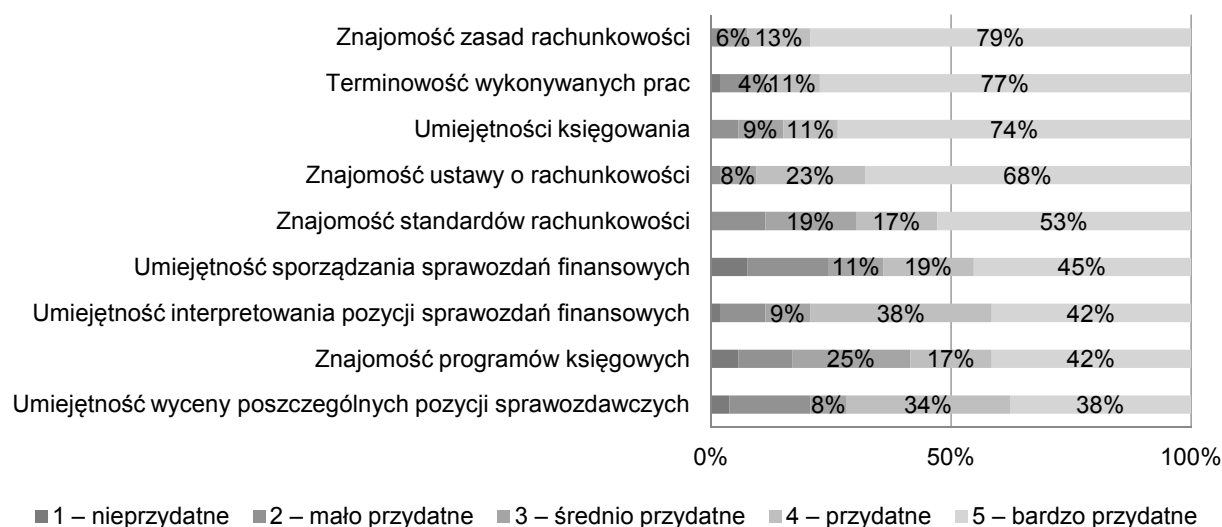
Rys. 1. Umiejętności przydatne w pracy księgowego według opinii pracodawców

Pracodawcy mieli możliwość wskazania innych umiejętności, jakie ich zdaniem powinien posiadać kandydat na księgowego. Anketowani najczęściej wskazywali na: