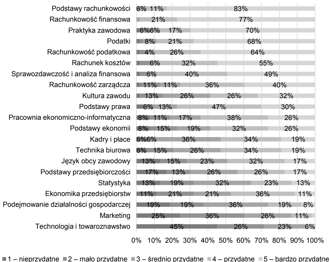
Rys. 2. Przydatność przedmiotów nauczanych w szkołach ponadgimnazjalnych i wyższych według pracodawców

Programy nauczania powinny uwzględniać praktykę zawodową w zwiększonym wymiarze czasu, a biorąc pod uwagę oczekiwania pracodawców, powinny dodatkowo zawierać treści związane z: